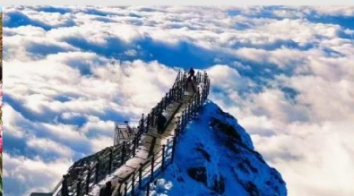
ภูเขาหิมะเจี๋ยวจื่อ