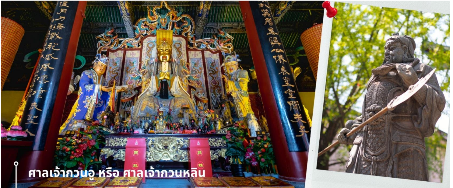
ศาลเจ้ากวนอู หรือ ศาลเจ้ากวนหลิน

CZHYCU1 ซีอาน ถั่วหยาง วัดเส้าหลิน สุสานจิ้นซี วัดลามะ 6วัน 5คืน ZH เซินเจิ้นแอร์ไลน์