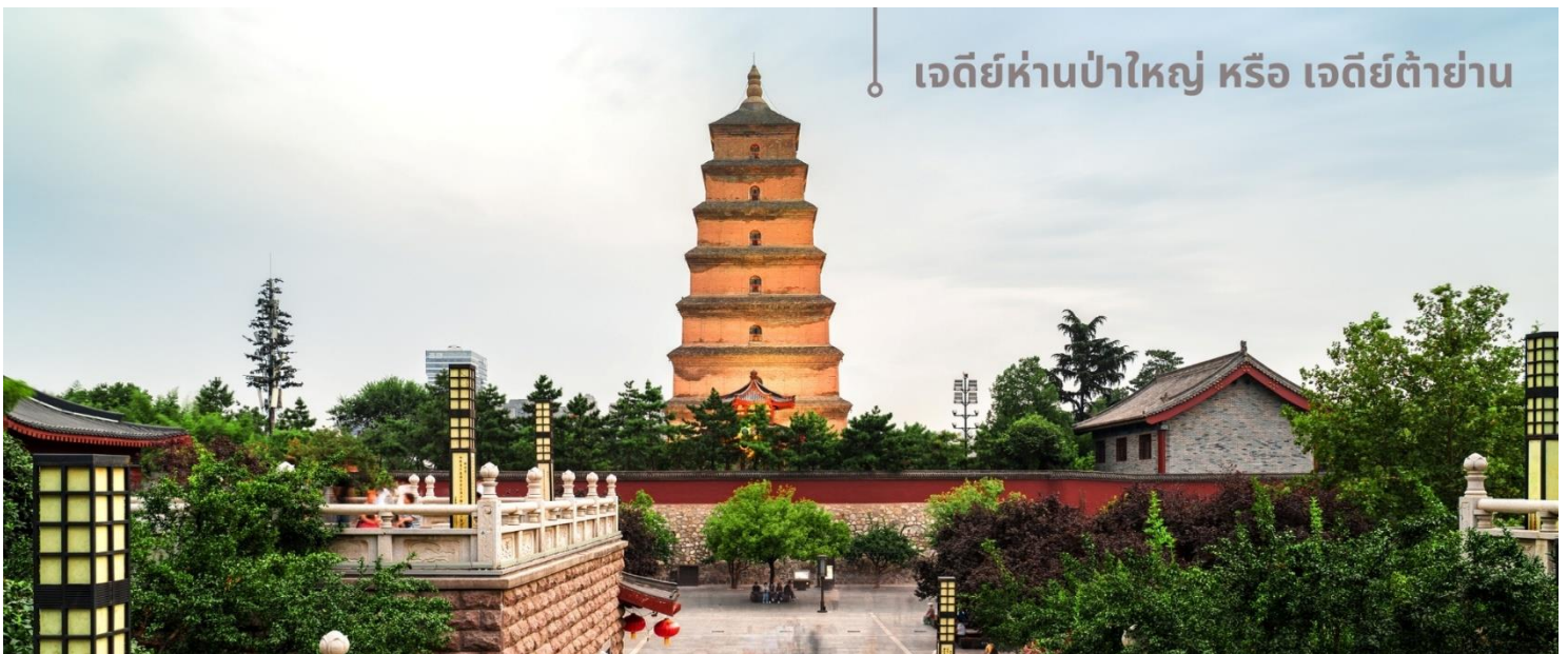
เจดีย์ห่านป่าใหญ่ หรือ เจดีย์ต้ายาน

จากนั้นนำท่านเที่ยวชม เจดีย์ห่านป่าใหญ่ หรือ เจดีย์ต้ายาน สถานที่ท่องเที่ยวระดับ 4A อายุมากกว่า 1,300 ปี ตั้งอยู่ในบริเวณวัดต้าฉือเอิน ซึ่งเป็นวัดสำคัญที่พระถังซำจั๋งเคยพำนัก ในตอนใต้ของเมืองซีอาน มณฑลฉ่านซี ตัวเจดีย์สร้างขึ้นใน ค.ศ.652 ในสมัยราชวงศ์ถัง โดยพระถังซำจั๋ง(หรือพระเสวียนจ่าง) ได้เสนอให้สร้างขึ้นเพื่อเก็บพระคัมภีร์และวัตถุที่ได้นำกลับมาจากชมพูทวีปในช่วงการเดินทางไปแสวงบุญที่อินเดีย เจดีย์ห่านป่าใหญ่มีความสูงประมาณ 64 เมตรในปัจจุบัน หลังผ่านการบูรณะและปรับปรุงหลายครั้ง โครงสร้างของเจดีย์ทำจากอิฐและมีการออกแบบที่เรียบง่ายแต่สง่างาม แสดงถึงสถาปัตยกรรมสมัยราชวงศ์ถัง แต่ด้วยเหตุแผ่นดินไหวในเวลาต่อมา บางส่วนของเจดีย์ถล่มลง ทำให้ปัจจุบันเหลือเพียง 7 ชั้นเท่านั้น ส่วนที่มาของชื่อเจดีย์ ตำนานเล่าว่ามีพระสงฆ์ในกลุ่มหนึ่งที่นับถือลัทธิแบบมหายาน เคยขาดแคลนอาหารอย่างหนัก วันหนึ่งพระสงฆ์เห็นฝูงห่านป่าบินผ่าน สงฆ์บางคนอธิษฐานต่อพระพุทธเจ้าให้พวกเขาได้รับอาหารเพียงพอสำหรับดำรงชีวิต ทันใดนั้น ห่านป่าตัวหนึ่งตกลงมาจากท้องฟ้าชนเข้ากับเจดีย์ ถึงแก่ความตาย เหล่าพระสงฆ์เชื่อว่าเป็นการสละร่างให้เป็นอาหาร จึงเชื่อกันว่าห่านตัวนั้นคือสัญลักษณ์ของพระเมตตา บ้างก็ว่าห่านตัวนั้นคือพระโพธิสัตว์ จึง