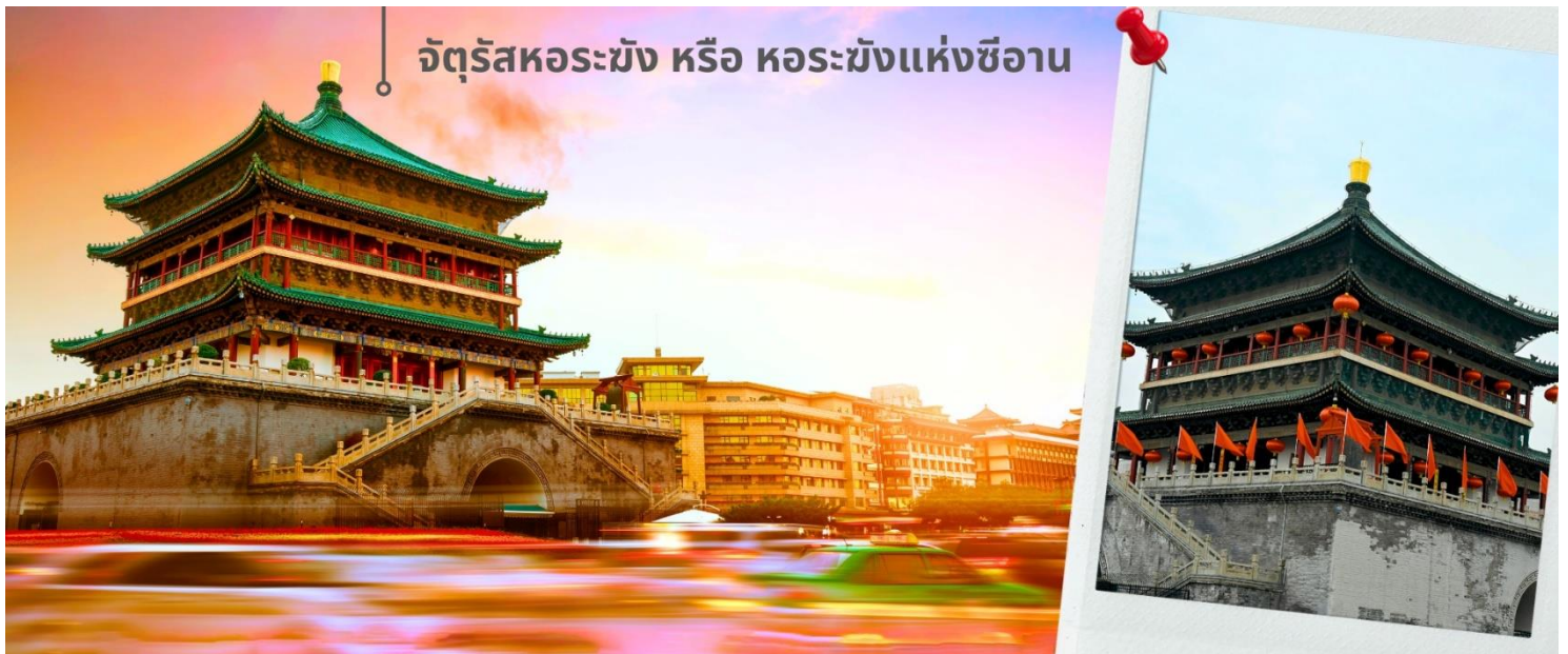
จัตุรัสหอรบั้ง หรือ หอรบั้งแห่งซีอาน

จากนั้นนำท่านเดินทางเที่ยวชม จัตุรัสหอรบั้ง หรือ หอรบั้งแห่งซีอาน เป็นหนึ่งในสัญลักษณ์สำคัญของเมืองซีอาน ตั้งอยู่ใจกลางเมือง สร้างขึ้นในปี ค.ศ. 1384 สมัยราชวงศ์หมิง เพื่อใช้ประกาศเวลาและเตือนภัยจากศัตรู ตัวหอสร้างจากไม้ทั้งหลัง มีความสูงประมาณ 36 เมตร โดดเด่นด้วยสถาปัตยกรรมจีนโบราณที่งดงาม และการประดับด้วยลวดลายสีทองและเขียว จัตุรัสแห่งนี้เป็นจุดตัดของถนนสายหลักทั้งสี่สาย สามารถขึ้นไปชมวิวเมืองซีอานแบบพาโนรามาได้ด้านบน