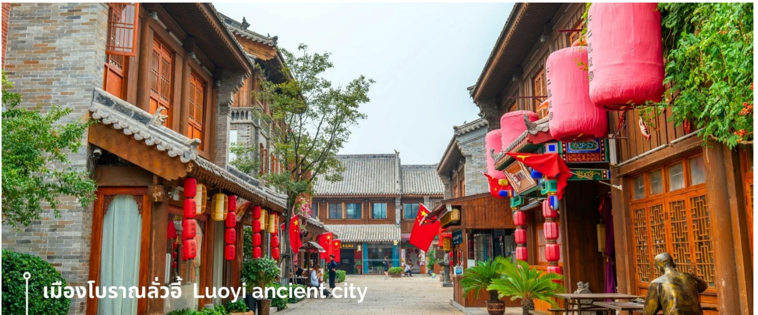
เมืองโบราณลั่วอี้ Luoyi ancient city

นำท่านเที่ยวชม เมืองโบราณลั่วอี้ เป็นสถานที่ท่องเที่ยวระดับ 1A ตั้งอยู่ในเมืองเก่าของเมืองถั่วหยาง เมืองหลวงโบราณของราชวงศ์ทั้ง 13 ราชวงศ์ บรรยากาศคอบอลไปด้วยเสน่ห์แบบจีนโบราณ ที่ยังคงอยู่มายาวนานหลายร้อยปี เมื่อเดินเล่นผ่านเมืองโบราณลั่วอี้ จะเห็นสถาปัตยกรรมบ้านเรือน ที่มีชายคาซ้อนกันเป็นชั้นๆ และกำแพงเมือง สนามหญ้า