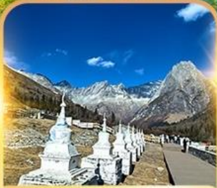
สวิตเซอร์แลนด์แดนมังกร