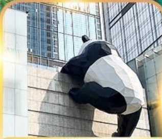
แพนด้าปิ่นตึก