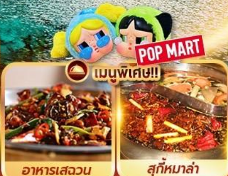
อาหารเสฉวน