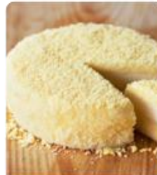
ร้าน LeTAO ร้านนี้ผลิตเค้กแอมองรอย ด้วยบรรยากาศใน ร้านที่ตกแต่งสวยไว้ที่แสนอบอุ่น ใจกลาง ด้วยเพลงจากถนนฮิดะชิบะซึกิ