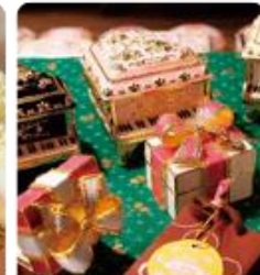
กล่องดนตรี MUSIC BOX