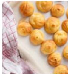
ร้าน KITAKARO ซึ่งมีขนมแบบอบจากเตาตุงๆ 100 กว่า ให้เลือกรับประทานกันเลยทีเดียว และเหมาะที่จะซื้อของฝากเป็นอย่างดี