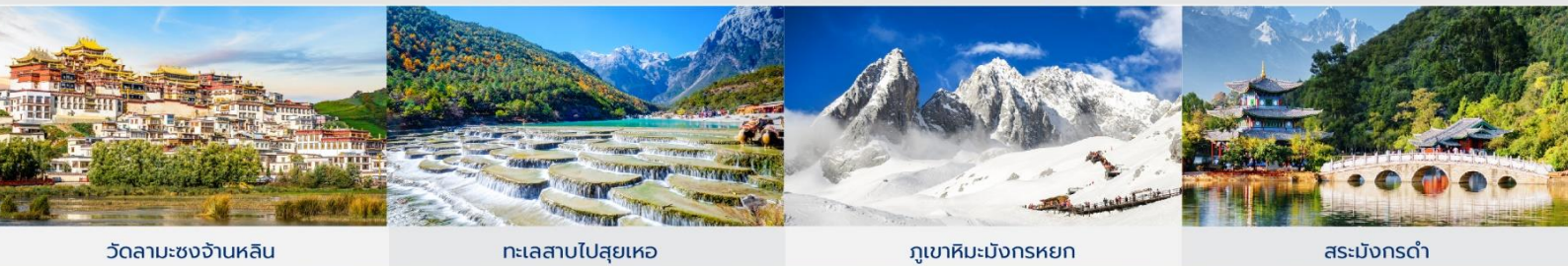
วัดลามะชงจันหลิน