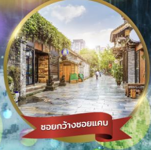
ชอยกว้างชอยแคบ