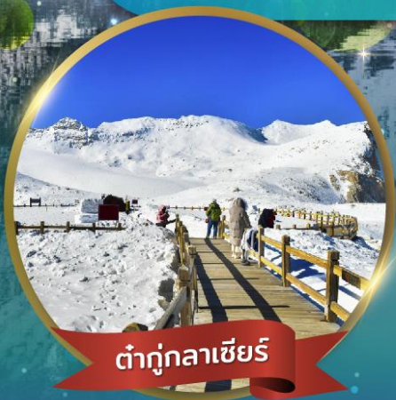
ต่ากุกลาเซียร์