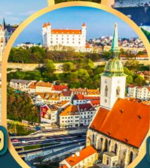
ปราติสลาวา