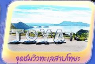
จุดชมวิวกะเลสาบโทยะ