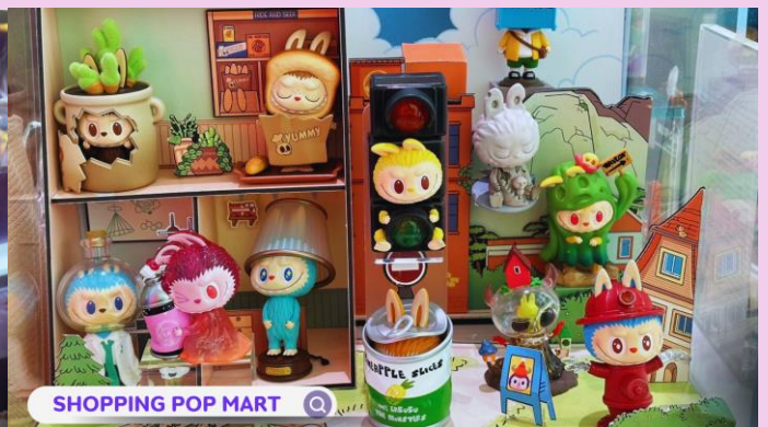
SHOPPING POP MART