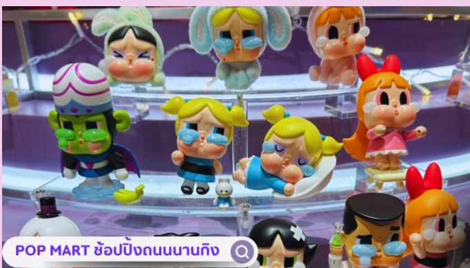
POP MART ซ้อปิงกนบนานกิง

นำท่านสู่บริเวณ หาดไว่ทาน (WAITAN) ซึ่งไม่ได้เป็นหาดทรายชายทะเลแต่อย่างใด แต่เป็นย่านถนนริมแม่น้ำที่มีความยาว 1.5 กิโลเมตร ไปตามริมแม่น้ำหวงผู่ฝั่งตะวันตกซึ่งอยู่ในย่านเมืองเก่า หาดไว่ทานยังเคยเป็นสถานที่ถ่ายทำภาพยนตร์ที่โด่งดังเรื่อง “เจ้าพ่อเซี่ยงไฮ้”