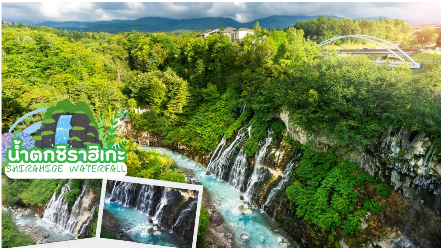
น้ำตกชิราฮิเกะ SHIRAHIGE WATERFALL

รอบๆ มีต้นไม้ที่ร่มรื่นเขียวชอุ่มในฤดูร้อน และมีสะพานที่เรียกว่า Blue River Bridge ที่สร้างขึ้นสำหรับดูความสวยงามของแม่น้ำแห่งนี้ ซึ่งความโดดเด่นของสีฟ้าสดใสของแม่น้ำแห่งนี้ ภาพแม่น้ำสีฟ้าและธารน้ำตกสีขาวตัดกันออกมาเป็นภาพของธรรมชาติที่น่าทึ่งและสวยงามมาก