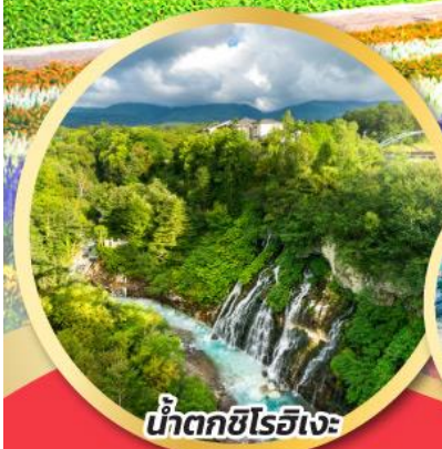
น้ำตกชิโรอิเงะ