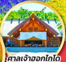
ศาลเจ้าออกโกโด