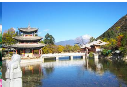
สะพานบึงรดำ