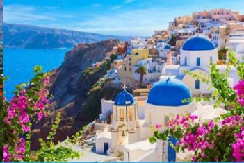
ย่านซานโตรินี่