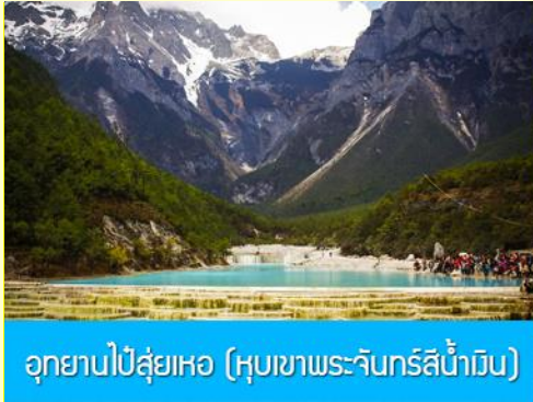
อุทยานป๋ายู่ยเหอ (หุบเขาพระจันทร์สีน้ำเงิน)

เสมือนพรมผืนมหึมาที่ปูอยู่บริเวณไหล่เขาของภูเขาหิมะมังกรหยก ได้รับการขนานนามว่าเป็นสวิสแห่งมณฑลยูนนาน