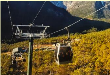
บึงกระเช้าสถานี หยุนชานผิง

หรือท่านสามารถเลือกซื้อโปรแกรมเสริม OPTIONAL TOUR แพคเกจท่องเที่ยวภูเขาหิมะมังกรหยกแบบครึ่งวัน อัตราค่าบริการท่านละ 3,500 บาท ในอัตราค่าบริการรวมรายการดังนี้