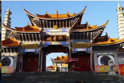
วัดเจ้าแม่กวนอิมเปลงกาย