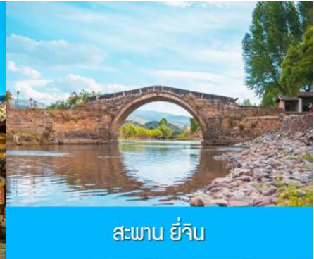
สะพาน ยี่จิ้น

หลังอาหารนำท่านเที่ยวชม หมู่บ้านโบราณซาซี 沙溪古镇 ชุมชนโบราณเก่าแก่ที่มีอายุกว่า 1,200 ปี เป็นชุมชนทางสำคัญของพ่อค้าเกลือและพ่อค้าชาที่คึกคักในอดีต ชม สะพาน ยี่จิ้น 玉津桥 สะพานโค้งโบราณจีนอายุกว่า 350 ปีที่เป็นสะพานที่การวานขนส่งสินค้าจากเหนือลงใต้ หรือจากใต้ขึ้นเหนือต้องใช้เป็นทางผ่าน ซึ่งได้ชื่อว่าเป็นสะพานอันดับหนึ่งในดินแดนต้าหลี่ ชมถนนโบราณที่ปูด้วยหินทรายแดงเข้ม โรงเตี๊ยมและโรงจิวโบราณที่ยังถูกอนุรักษ์ไว้เป็นอย่างดี ให้ท่านเลือกชมและถ่ายรูปจากมุมสวยภายในหมู่บ้านโบราณจนครบถ้วน นำท่านเดินทางโดยรถบัสสู่เมืองลี่เจียง (ระยะทาง 188 กม.ใช้เวลาเดินทางผ่านถนนซูเปอร์ไฮเวย์ประมาณ 2 ชั่วโมงครึ่ง)