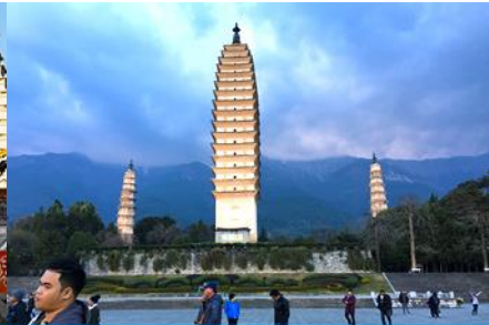
เจดีย์สามองค์