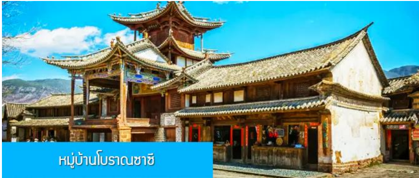
หมู่บ้านโบราณซาซี