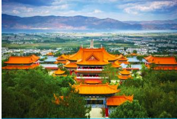
เมืองต้าหลี่