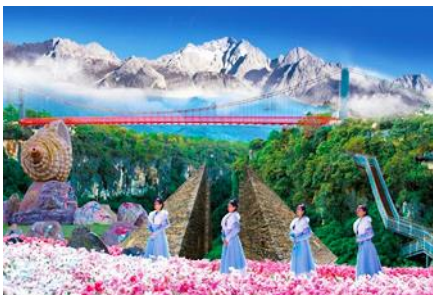
Snow Mountain Canyon Park

พักที่ LIJIANG FENGHUANG HOTEL โรงแรมระดับ 4 ดาวท้องถิ่น หรือเทียบเท่าในเมืองลี่เจียง