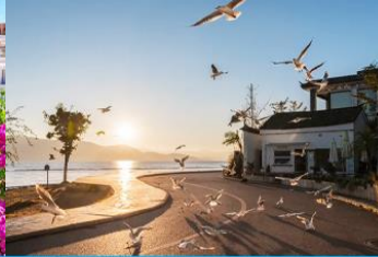
ย่านชายหาดรูป S