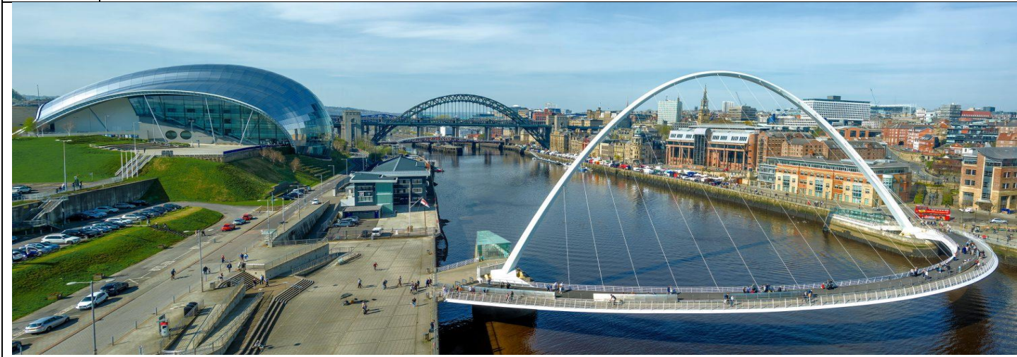
Tyne Bridge สะพานข้ามแม่น้ำไทน์ ที่เป็นดังสัญลักษณ์ของเมืองนิวคาสเซิล

14.30 น. นำคณะเดินทางเที่ยวชม เมือง นิวคาสเซิล | Newcastle upon Tyne