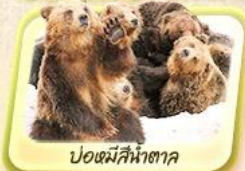
บ่อหมีสีน้ำตาล