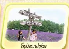
โทมิตะฟาร์ม