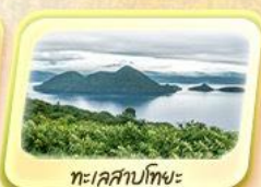
ทะเลสาบโทยะ