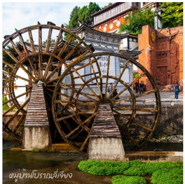
หมู่บ้านโบราณลี่เจียง