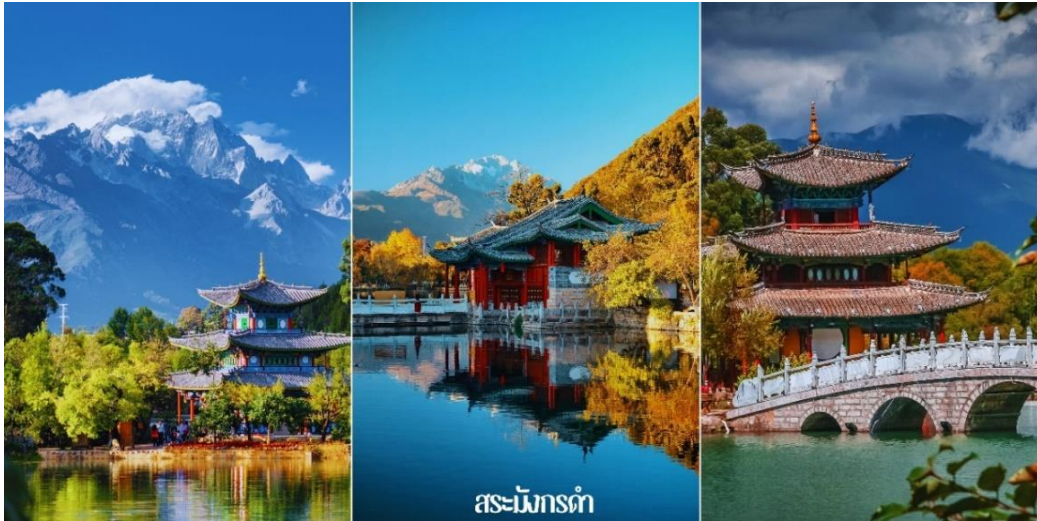
สระมังกรดำ

จากนั้นนำท่านสู่ร้านสินค้าพื้นเมืองร้านหยก