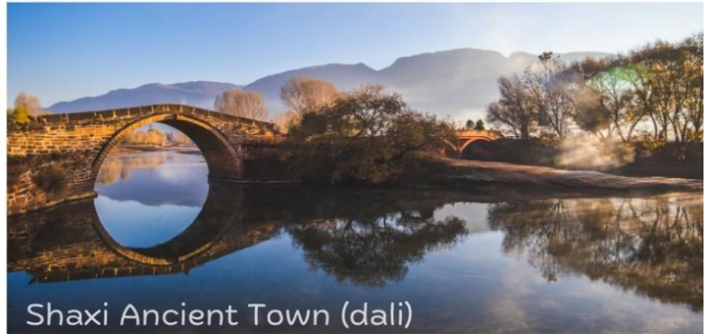
Shaxi Ancient Town (dali)