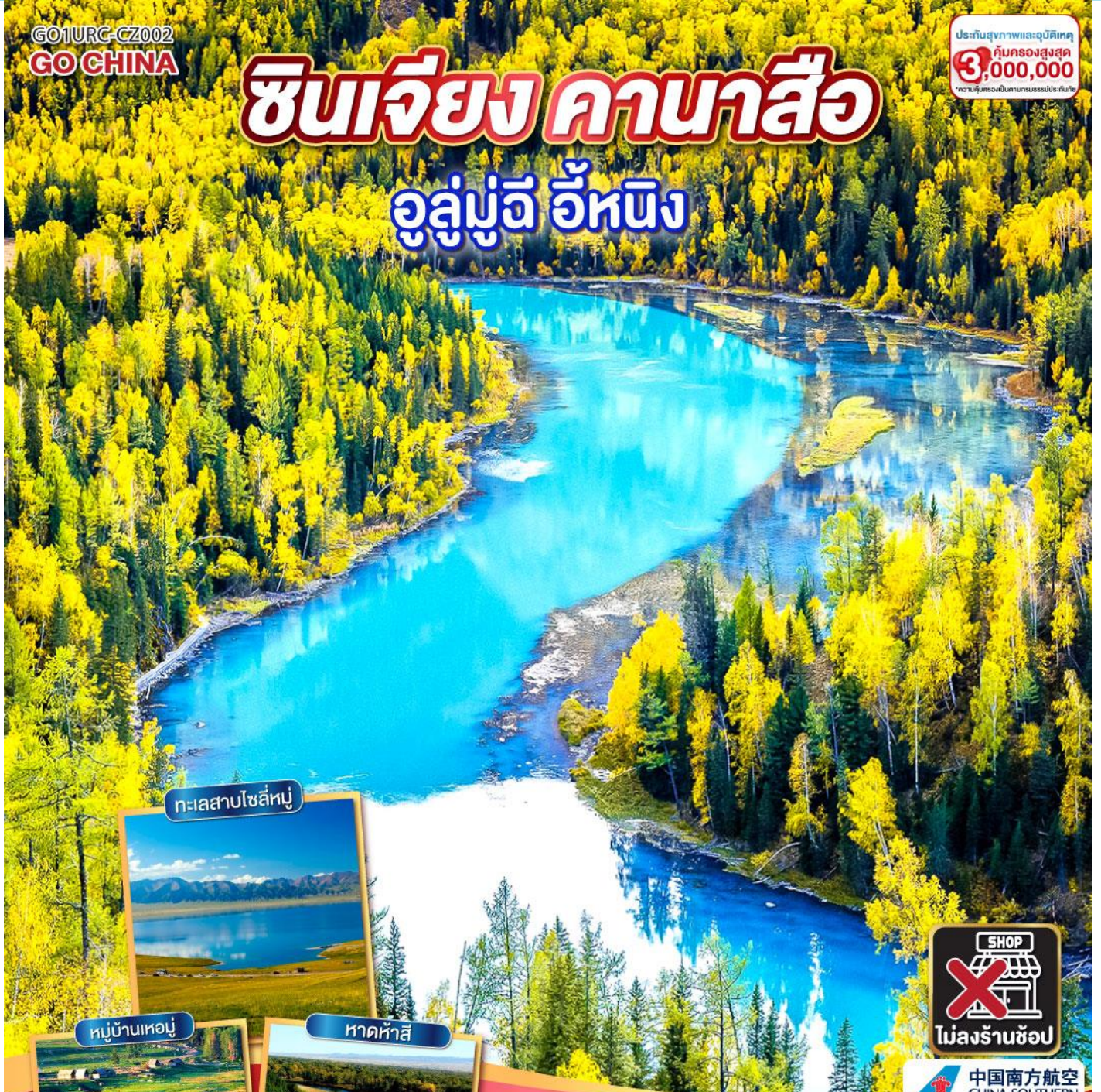
ทะเลสาบโซลีนู