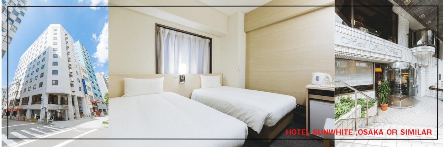
HOTEL SUNWHITE ,OSAKA OR SIMILAR