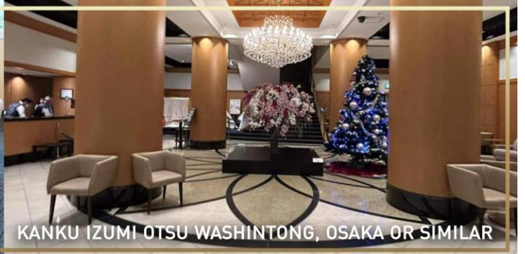
KANKU IZUMI OTSU WASHINTONG, OSAKA OR SIMILAR

วันที่ 2 ปราสาทฮิเมจิ – โรงกลั่นสาเก NADAGIKU - โกเบ พอร์ท ทาวเวอร์ – ย่านชินเซไก (B/L/–)