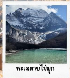
ทะเลสาบไข่มุก