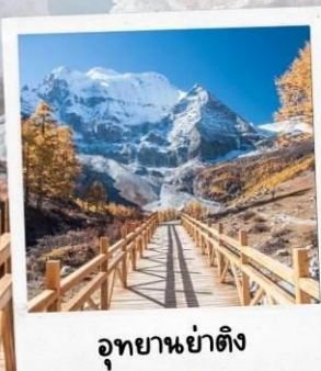
อุทยานย่าติง