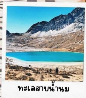
ทะเลสาบน้ำนม