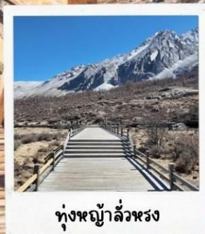
ทุ่งหญ้าสีหรง