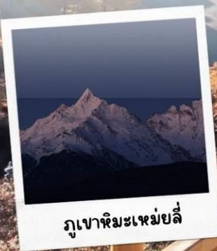
ภูเขาหิมะเหม่ยหนลี่