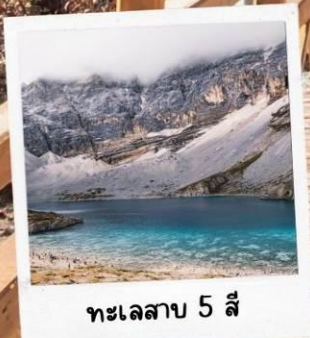
ทะเลสาบ 5 สี