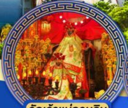
วัดเจ้าแม่กวนอิม อ่องอ่า