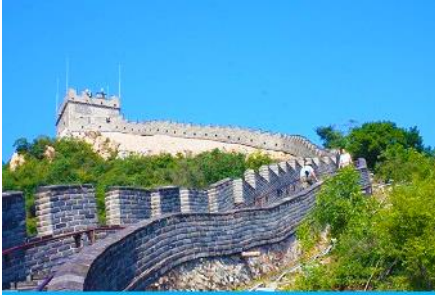
กำแพงเมืองจีนด่านฉวิยงกวน

พักที่ JINGLIN HTL OR HOLIDAY INN EXPRESS HTL 4* หรือโรงแรมในระดับเดียวกันในกรุงปักกิ่ง