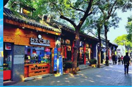
ชอยหนานหลัวกู่เซียง

วันที่สาม กำแพงเมืองจีนด่านฉวิยงกวน – ศูนย์จำหน่ายหยก-สนามกีฬารังนก(ชมด้านนอก) - ชอยหนานหลัวกู่เซียง