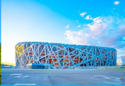
สนามกีฬาโอลิมปิก