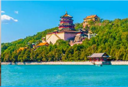
พระราชวังฤดูร้อนหยี่เหอหยวน