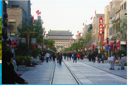
ถนนเจียนเหมิน