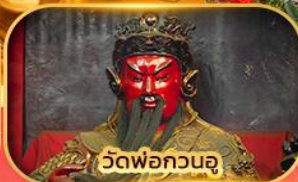
วัดพ่อกวนอู