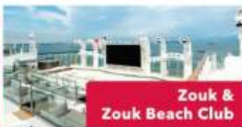
Zouk & Zouk Beach Club