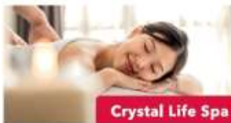
Crystal Life Spa

Enjoy live production shows from the acclaimed award-winning entertainment team.