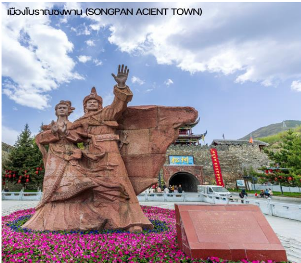
เมืองโบราณซงพาน (SONGPAN ACIENT TOWN)

ธรรมชาติบางครั้งก็แฝงด้วยความโหดร้าย อีสระให้ท่านพักผ่อนอิริยาบถ หรือถ่ายรูปคู่กับจามรีสีขาวงามตัดกับฟ้าสีครามและน้ำสีเขียวมรกต