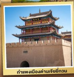
กำแพงเมืองด่านเจียหยี่กวน