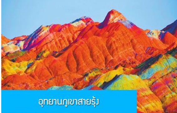
อุทยานภูเขาสายรุ้ง