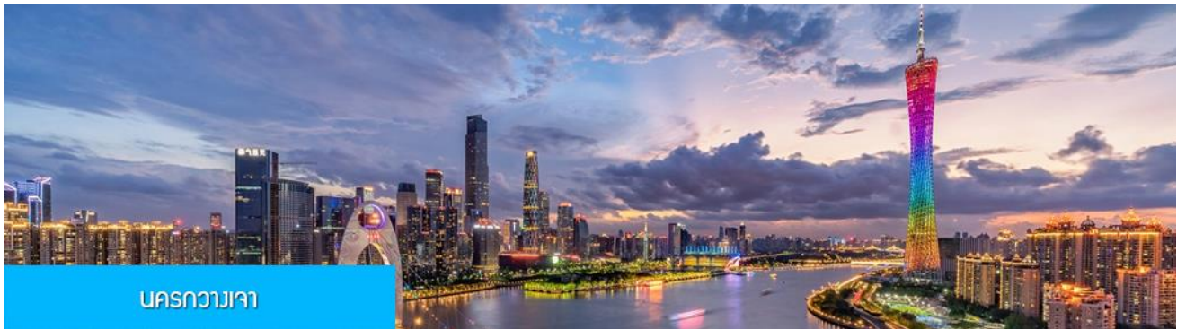
นครกวางเจา