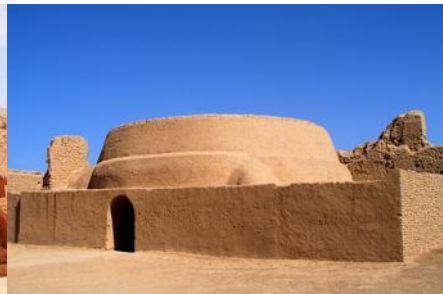
เมืองโบราณเกาซางอู๋เจิง

วันที่หก ชมระบบชลประทานอู๋หลู่ฟาน – ถ้ำพระพันองค์- เมืองโบราณเกาซางอู๋เจิง–เดินทางสู่เมืองอูร์มุฉี