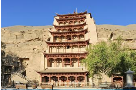
ถ้ำหินมั่วเกา