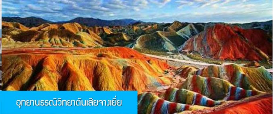
อุทยานธรณีวิทยาต้นเสียวายี่

วันที่สอง เมืองหลันโจว – นั้รถไฟความเร็วสูงสู่เมืองจางเยี่ย – เที่ยวชมอุทยานธรณีวิทยาต้นเสียว(ภูเขาสายรุ้ง)