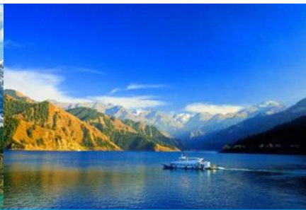
ล่องเรือทะเลสาบเทียนฉือ