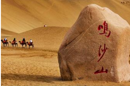
เป็นทรายหมีซาซาน