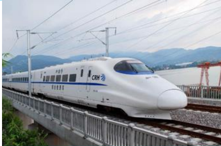
นิ้งรถไฟความเร็วสูง