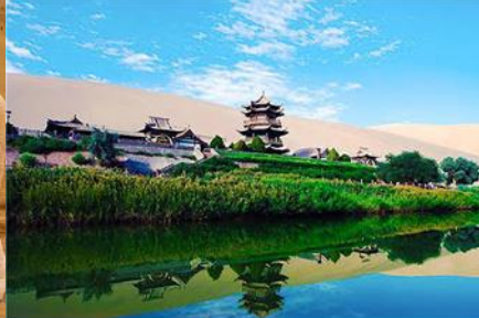
สระน้ำวงพระจันทร์