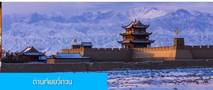
ด่านเกี๋ยวี่กวน