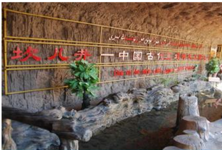
ระบบชลประทานอู๋หลู่ฟาน

พักที่ HAMPTON BY HILTON HOTEL โรงแรมระดับ 4 ดาวหรือเทียบเท่าในเมืองอู๋หลู่ฟาน