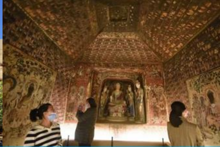
ชมภาพยนตร์ 3 มิติ