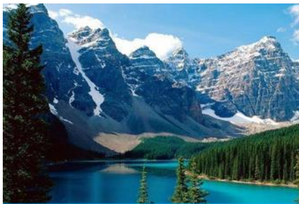
ภูเขาเทียนชาน

พักที่ MERCURE HOTEL โรงแรมระดับ 4 ดาวท้องถิ่นหรือเทียบเท่าในเมืองอูรุมฉี