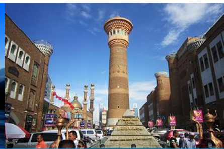
ตลาดต้าปาจา