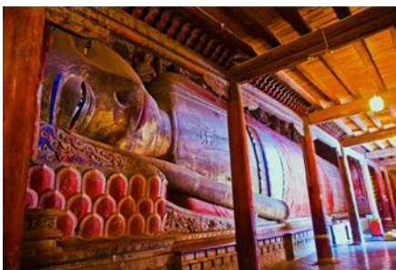
วัดพระใหญ่

พักที่ SILU QIAN XI HOTEL โรงแรมระดับ 4 ดาวท้องถิ่น หรือเทียบเท่าในเมืองจางเจี้ยน