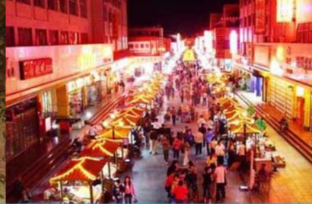
ตลาดกลางคืน ซาโจว