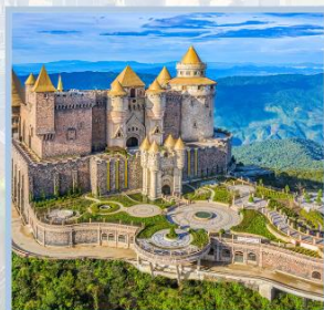
ปราสาทจันตรา