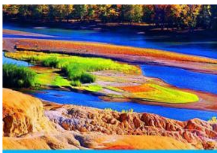
หาดธารน้ำห้าสี