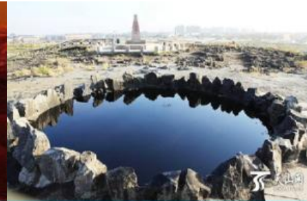
บ่อน้ำมันสีดำ