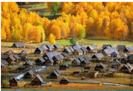
หมู่บ้านเหม่อซุน

พักที่ SU TONG HOLIDAY HOTEL โรงแรมระดับ 4 ดาวท้องถิ่น หรือเทียบเท่าในเมืองปูเอ๋อจิน