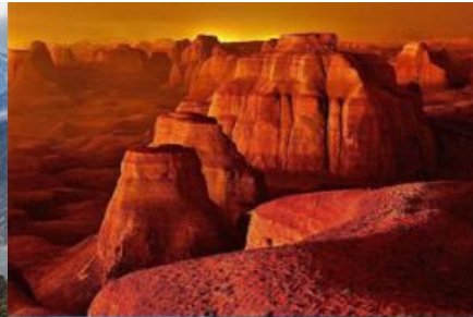
เมืองผิงอู่อ๋อเหอ