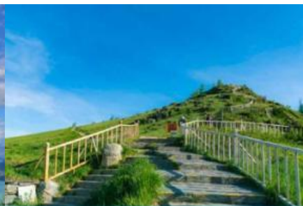
จุดชมวิวกานาสือ