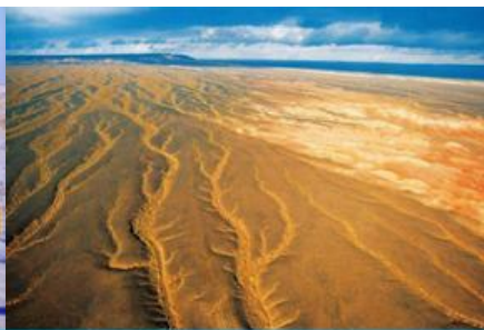
ทะเลทรายกู่อ๋อปิ่นทงกู๋เร่อ