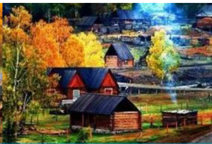
บ้านชนเผ่าอุ๋หว่า