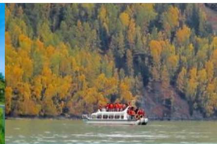
ล่องเรือชมทะเลสาบคานาสือ

หลังอาหารเข้านำท่านสู่ จุดชมวิวกานาสือ 喀纳斯观景台 จุดชมวิวนบนเนินสูงที่สามารถมองเห็นทัศนียภาพ ของอุทยานจากมุมสูง.....ชม ศาลาชมปลา 观鱼亭 หอชมวิวนยอดเขาอุฐูทางด้านทิศตะวันตกของอุทยานฯ อยู่สูงเหนือระดับน้ำในทะเลสาบ 600 เมตร (เหนือระดับน้ำทะเล 2030 เมตร) ณ จุดนี้ท่านสามารถมองเห็น ทัศนียภาพโดยรอบที่ประกอบด้วยทุ่งหญ้า ป่าไม้ ภูเขาหิมะที่ห่างไกลภายในอุทยานคานาสือ (การขึ้นหอชมปลา ต้องปีนบันไดหลายร้อยขั้น ท่านที่ไม่สะดวกที่จะปีนบันไดสามารถชมวิวยู่ด้านล่าง)