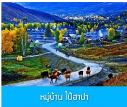
หมู่บ้าน ไปฮาปา