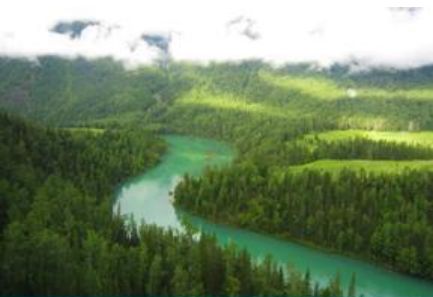
ทะเลสาบเลี้ยวพระจันทร์

พักที่ BEI YUAN SHAN ZHUANG HOTEL ระดับ 4 ดาวท้องถิ่นหรือเทียบเท่าในเมืองเจี๋ยเตงยวี่ใกล้กับเขตอุทยานฯ