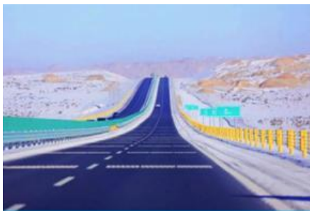
S21 DESERT HIGHWAY