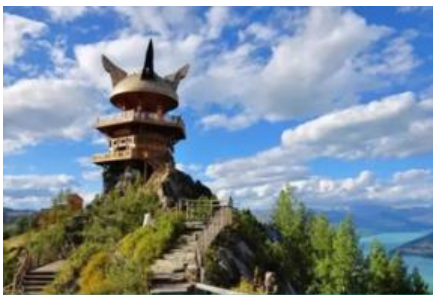
ศาลาชมปลา

รับประทานอาหารกลางวัน ณ ร้านอาหารในเขตอุทยานฯ (เมนูอาหารอัฟเกรด 80 หยวน/หัว)