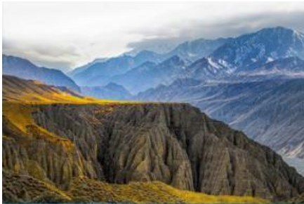
เมืองเคลาหม่า