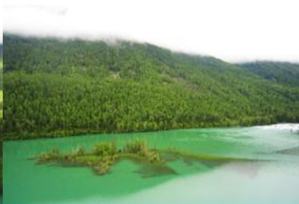
ทะเลสาบบึงกรหลับ