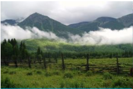
อุทยานคานาสีอ