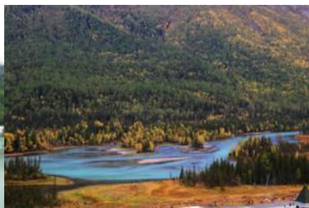
ทะเลสาบเทวดา

วันที่ 1 อุทยานคานาสีอรอบแรก – ทะเลสาบเลี้ยวพระจันทร์ – ทะเลสาบมังกรหมอบ – ทะเลสาบเทวดา – ศาลาชมปลา-ล่องเรือชมทะเลสาบ