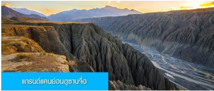
แกรนด์แคนยอนตูซานจื่อ