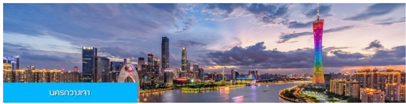
นครกวางเจา