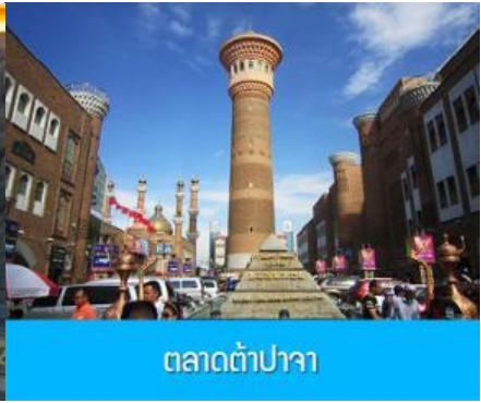
ตลาดต้าปาจา