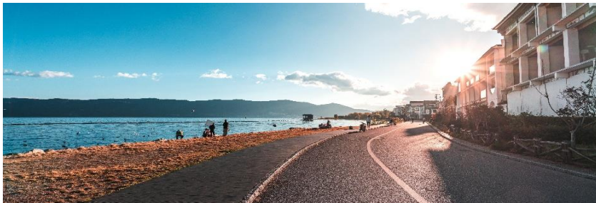
ทะเลสาบเอ๋อไห่ Dali Panxi S Bay

นำท่านชมทะเลสาบเอ๋อไห่ เป็นทะเลสาบน้ำจืดบนที่ราบสูงที่ใหญ่เป็นอันดับ 2 ของจีนรองจากทะเลสาบเตียนจื่อในเมืองคุนหมิง อยู่ในระดับความสูง 1,972 เมตรเหนือระดับน้ำทะเล คนไทยเรียกทะเลสาบแห่งนี้ว่า "หนองแส" และเชื่อว่าเป็นจุดเริ่มต้นความเชื่อเรื่อง "พญานาค" ทะเลสาบเอ๋อไห่ ระหว่างทางให้ท่านได้ถ่ายรูปเก็บบรรยากาศทะเลสาบที่ราบสูงเอ๋อไห่ และชมจุดยอดนิคมที่นักท่องเที่ยวนิยมมาแวะเก็บภาพสวยๆ ของ Dali Panxi S Bay (โด่งถนนตัวS) อิสระถ่ายภาพและเลือกซื้อป๊อปปิ้งตามอัธยาศัย