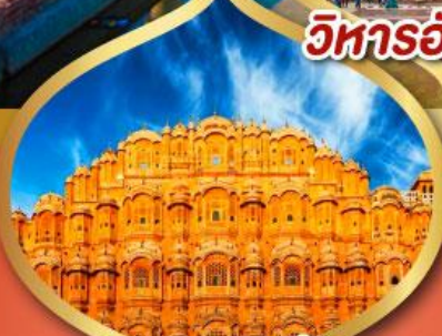
พระราชวัง สายลม