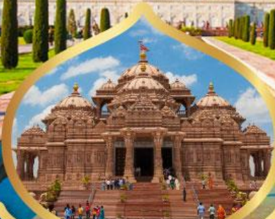
วิหารอักชาร์ดัม