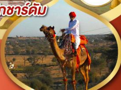
ฟรี ژیู่ดู เมืองมันทวา ราคาเริ่มต้น