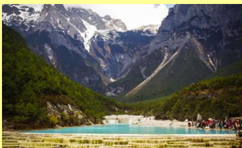
อุทยานไป่ส่วยเหอ (หุบเขาพระจันทร์สีน้ำเงิน)