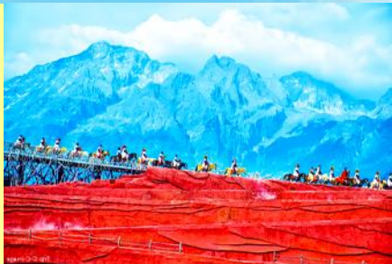
IMPRESSION OF LIJIANG