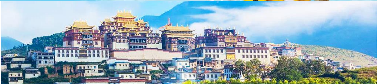
เมืองโบราณเซงกรีล่า