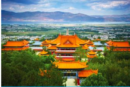
เมืองต้าหลี่