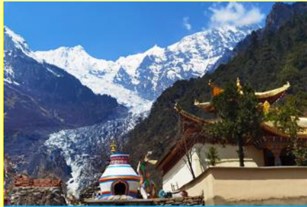
ธารน้ำแข็ง หมิวหย่ง