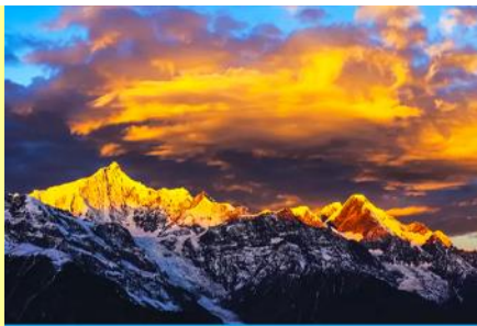
ภูเขาหิมะเหมยหลี่

หลังอาหารนำท่านเข้าสู่โรงแรมที่พักในเมืองเต๋อซัน ให้ท่านพักผ่อนหรือเดินเล่นถ่ายภาพในเมืองตามอัธยาศัย