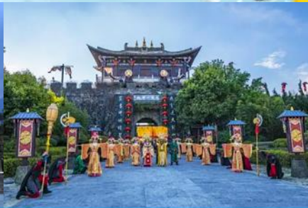
โรงถ่ายทำภาพยนตร์ แปดเทพอูร์มังกรฟ้า