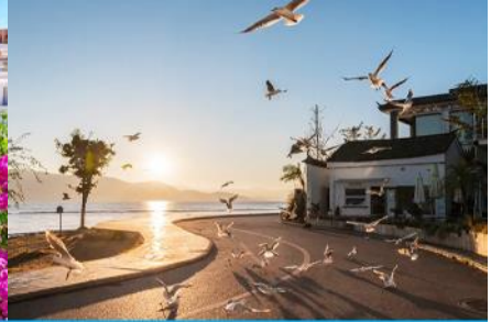
ย่านชายหาดรูป S