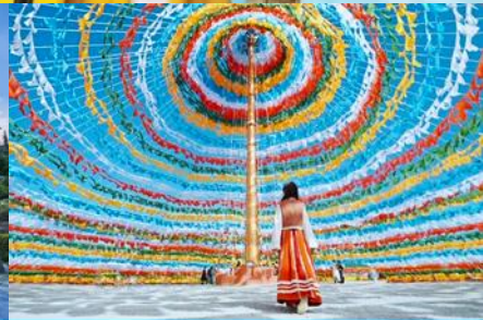
ซุ้มผ้ายันต์หลากสี

วันที่สอง เมืองต้าหลี่ – เจดีย์สามองค์ – โรงถ่ายหนังแปดเทพอูร์ฯ – เดินทางไปเซงกรี่ล่า – ซุ้มผ้ายันต์ – เมืองโบราณเซงกรี่ล่า