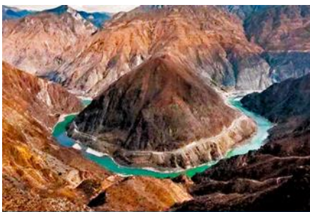
โค้งแรกของแม่น้ำจินซาเคียว

พักที่ PHOENIX HOTEL โรงแรมระดับ 4 ดาวท้องถิ่น หรือเทียบเท่าในเมืองเซงกรีล่า