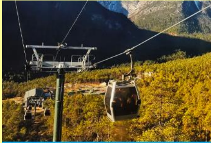
นั่งกระเช้าสถานี หยุนชานผิง