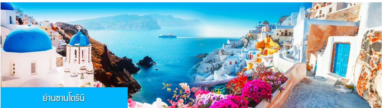
ย่านซานโตรินี่

นำท่านสู่ ย่านซานโตรินี่ 圣托里尼 จุดเช็คอินถ่ายภาพยอดนิยมริมทะเลสาบเอ้อไห่ เมืองต้าหลี่ นอกจากวิวริมทะเลสาบหลักล้าน ที่นี้ยังมีร้านกาแฟ(คาร์เฟ่) สไตล์กรีกสุดเก๋ไว้ที่ออกแบบตามคาเฟ่ดังบนเกาะซานโตรินี่ในประเทศกรีซ ตัวร้านกาแฟสร้างอยู่บนเชิงเขาริมทะเลสาบเอ้อไห่ เป็นจุดชมวิวทะเลสาบและพระอาทิตย์ตกดินที่