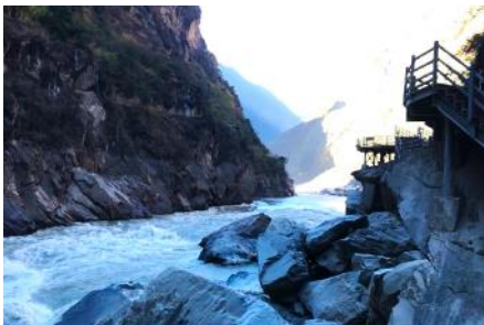
ช่องแคบเสื่อกระโถน

พักที่ DEQING HOTEL ระดับ 4 ดาวท้องถิ่นหรือเทียบเท่าในเมืองเต๋อซิ่น