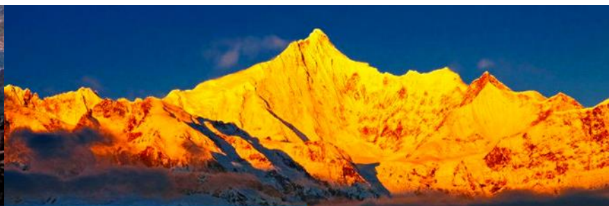
จุดชมวิว วูหมงต๊ว

วันที่สาม เมืองเต๋อซิ่น –จุดชมวิวแม่น้ำ U TURN–จุดชมวิวภูเขาหิมะเหมยหลี่ - OPTIONAL TOUR ใต้ท้องถึ่นนำเสนอโปรแกรมทัวร์เสริมเข้าชมอุทยานภูเขาหิมะเหมยหลี่