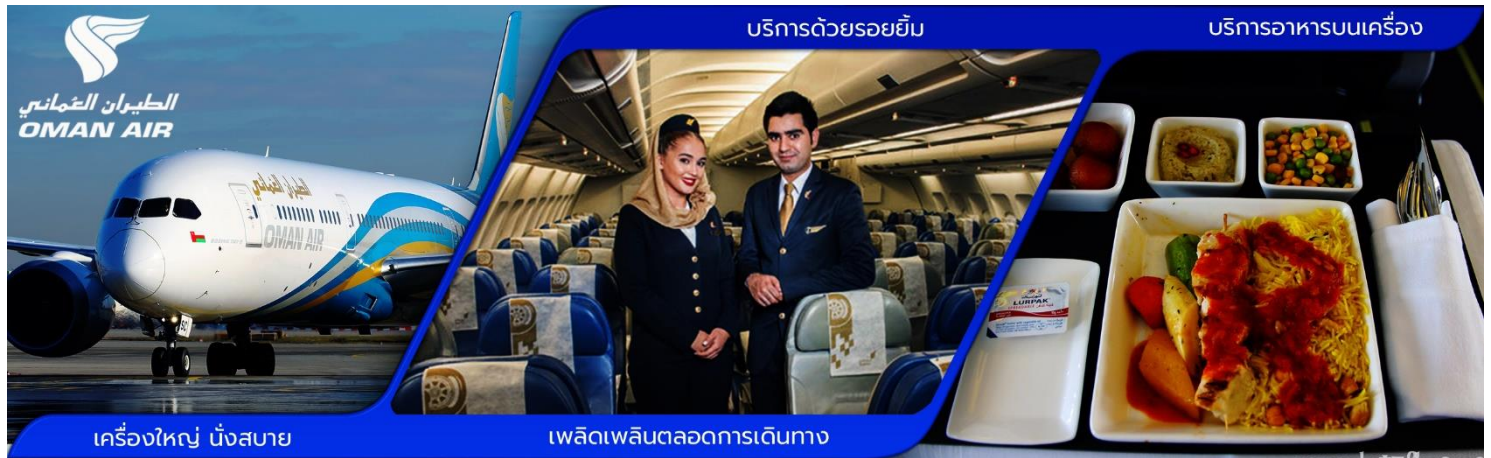
เครื่องบิน นิ่งสบาย

* การจัดที่นั่งบนเครื่องบินเป็นไปตามระบบสายการบินแบบหมู่คณะ ไม่สามารถเลือกที่นั่งได้ *