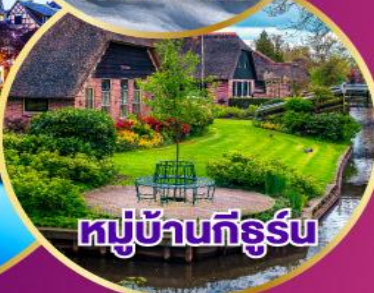
หมู่บ้านทีร์รูบ