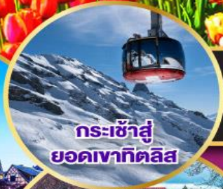
กระเช้าสู่ยอดเขาทิตลิส

19-28 มี.ค.68 / 01-10, 12-21, 14-23 เม.ย.68 03-12, 04-13, 05-14 พ.ค.68