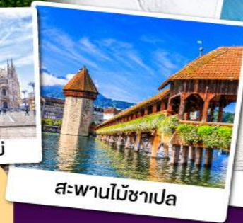
สะพานไม้ชาเปลา