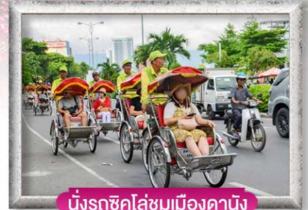
นั่งรถถีบไล่ชมเมืองดานัง