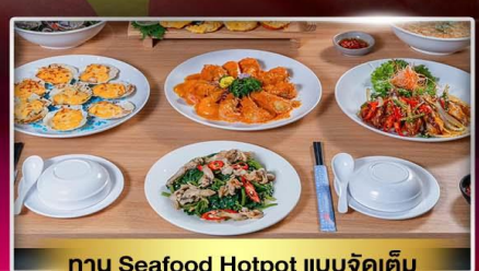
ทาน Seafood Hotpot แบบจัดเต็ม

บินร่วมกับสายการบินระดับโลก พักแบบ豪華 1 คืน