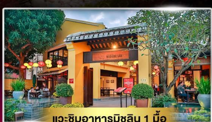
แวะชิมอาหารมิชลิน 1 มือ