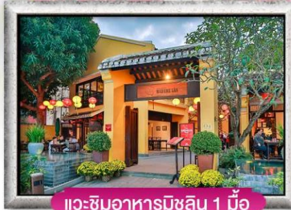
แเวซิมอาหารมิชลิน 1 มือ