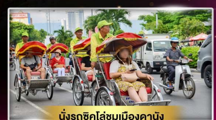
นั่งรถถีบไล่ชมเมืองดานัง