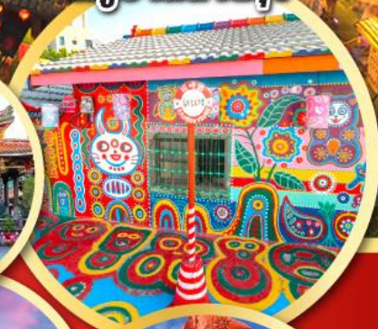
หมู่บ้านสายรุ้ง