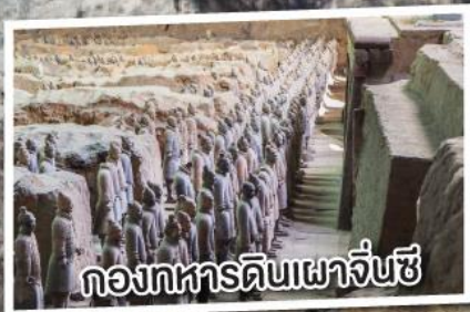
กองทหารดินเผาจิ๋นซี