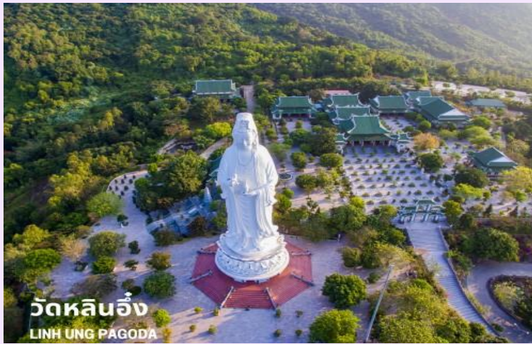
วัดหลินอึ้ง LINH UNG PAGODA

ได้เวลาอันสมควร นำท่านลงจากเขาบานาฮิลล์ เดินทางสู่เมืองดานัง ระหว่างทางนำท่านแวะร้านหยกและอัญมณี อีสระในการเลือกซื้อสินค้า