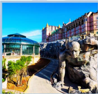
โซล Eclipse Square