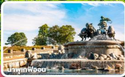
นพวงพ็อบ