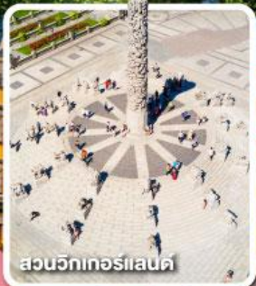
สวนวิกทอร์แลนด์