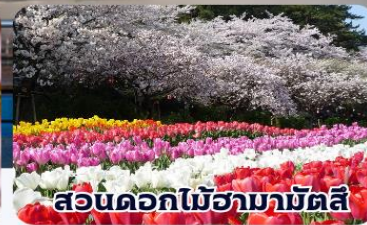
สวนดอกไม้ฮามามัตสึ