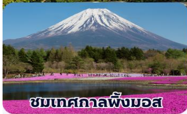
ชมเทศกาลฟิ่งมอส