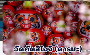
วัดคิตสึโอะจิ (คารุมะ)