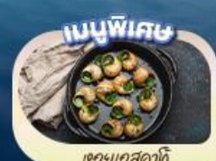
ของแถมพิเศษ

เดินทาง 9 - 16 พ.ค.68 19 - 26 พ.ค.68 26 พ.ค. - 2 มิ.ย.68