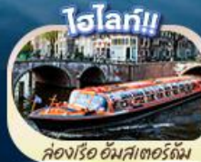
คลองเรือ อัมสเตอร์ดัม

สะพานโฮเอ็นชอลลีร์น ส่งเรือชมหมู่บ้านทีไรน์ กำพันลมซานส์คันส์ คลองอัมสเตอร์ดัม บรัสเซลส์ อะโตเมียม จัตุรัสรูจส์ หอไอเฟล จัตุรัสคองคอร์ด พิพิธภัณฑ์ลูฟร์ ส่งเรือแม่น้ำแซน ซุปบิงแบบจิวอี้ที่ห้างซินน่า