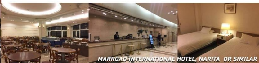
MARROAD INTERNATIONAL HOTEL, NARITA OR SIMILAR

ค่า อิสระอาหาร ตามอัยาศัยเพื่อสะดวกแก่การช้อปปิ้ง ที่พัก MARROAD INTERNATIONAL HOTEL, NARITA หรือเทียบเท่า