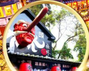
หมู่บ้านปศาจชโกว