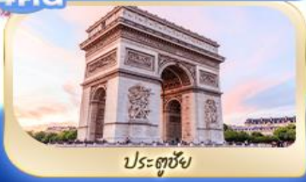
ประตูชัย