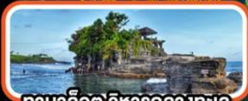
ทานาลือต วิหารกลางทะเล