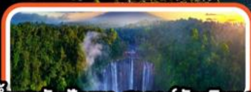
น้ำตกทับปดเซวู สวรรค์นักเดินทาง