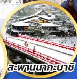
สะพานนากะบาชิ