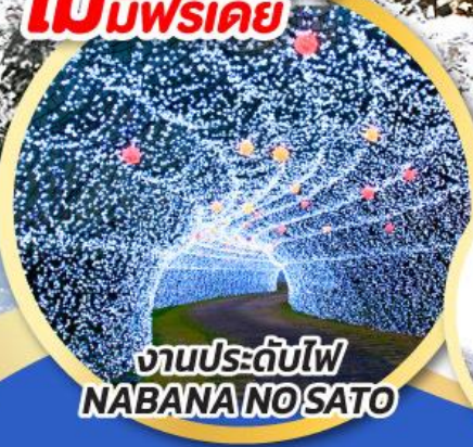
งานประดับไฟ NABANA NO SATO