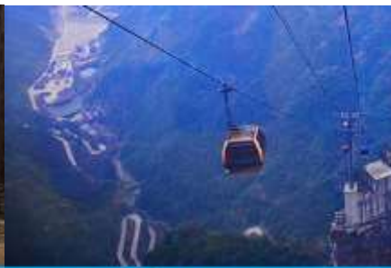
กระเช้าขึ้นเขาเทียนเหมินซาน