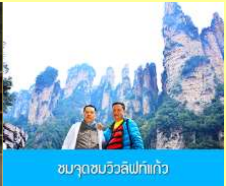
ชมจุดชมวิวลีเฟกแก้ว

โปรแกรมเสริมที่ 1 โปรแกรมเที่ยวชมอุทยานภูเขาอวตารแบบสั้นที่ไม่ขึ้นลิฟท์แก้ว (ผู้เข้าร่วมขั้นต่ำ 15 ท่าน) ใช้เวลาประมาณ 2-3 ชั่วโมง อัตราค่าบริการท่านละ 400 หยวนหรือ 2,000 บาท นำท่านเที่ยวชมจุดชมวิวล่าธารจินเปียนซีที่สามารถมองเห็นวิวยอดเขาอวตารได้ชัดเจน นำท่านเที่ยวชมจุดชมวิวจิบเปียนซี ลานชมวิวน้ำลิฟท์แก้วไปหลงที่สามารถมองเห็นทัศนียภาพของภูเขาอวตารและลิฟท์แก้วได้ชัดเจน (ไม่ได้รวมค่าขึ้นลิฟท์แก้ว) อัตราค่าบริการรวม ค่าบัตรเข้าอุทยาน ค่ารถรับส่งภายในเขตอุทยาน ค่าน้ำที่ขงไกด์ท้องถิ่น