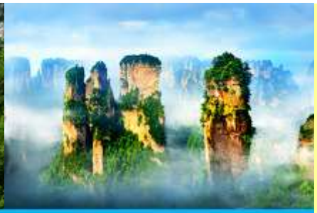
ภูเขาอวตาร

โปรแกรมเสริมที่ 2 โปรแกรมเที่ยวชมอุทยานภูเขาอวตารแบบครึ่งวันที่รวมค่าขึ้นลิฟท์แก้ว (ผู้เข้าร่วมขั้นต่ำ 15 ท่าน) ใช้เวลาประมาณ 4-6 ชั่วโมง (ขึ้นอยู่กับจำนวนนักท่องเที่ยวในแต่ละวัน) อัตราค่าบริการท่านละ 750 หยวนหรือ 3,750 บาท นำท่านเที่ยวชมจุดชมวิวลำธารจินเปียนซีที่สามารถมองเห็นวิวยอดเขาอวตารได้ชัดเจน นำท่านเที่ยวชมจุดชมวิวมณฑลฉวนชววิถึ ลานชมวิวน้ำลิฟท์แก้วแล้วไปหลงที่สามารถมองเห็นทัศนียภาพของภูเขาอวตารและลิฟท์แก้วได้ชัดเจน นำท่านขึ้นลิฟท์แก้วขึ้นสู่ยอดเขาอวตาร นำท่านเดินชมจุดชมวิวด่าง ๆ บนยอดเขาอวตารได้แก่ภูเขาฮาเลลูย่า สะพานหนึ่งในได้หล่า... อัตราค่าบริการรวม ค่าบัตรเข้าอุทยาน ค่ารถรับส่งภายในเขตอุทยาน ค่าน้ำเที่ยวของไกด์ท้องถิ่น