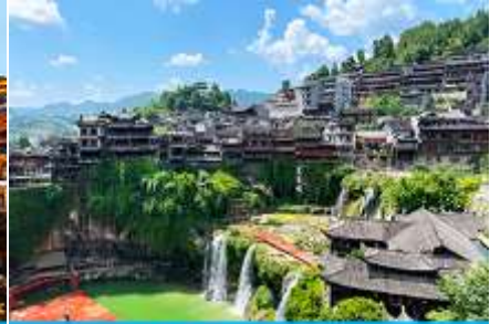
เมืองโบราณผู่หรงจิ้น