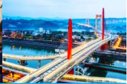
เมืองหยิซาง

วันที่ห้า เมืองจางเจียเจีย- เลือกซื้อโปรแกรมทัวร์เสริม OPTIONAL TOUR - ร้านหยก-ร้านใบชา-เมืองหยิซาง