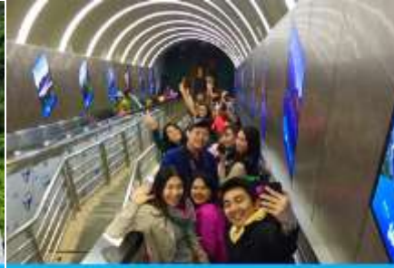
บันไดเลื่อนทะลุภูเขา