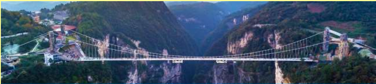
สะพานกระจากับหุบเขาแกรนด์แคนยอน

โปรแกรมเสริมที่ 2 โปรแกรมเที่ยวชมอุทยานภูเขาอวตารแบบครึ่งวันที่รวมค่าขึ้นลิฟท์แก้ว (ผู้เข้าร่วมขั้นต่ำ 15 ท่าน) ใช้เวลาประมาณ 4-6 ชั่วโมง (ขึ้นอยู่กับจำนวนนักท่องเที่ยวในแต่ละวัน) อัตราค่าบริการท่านละ 750 หยวนหรือ 3,750 บาท นำท่านเที่ยวชมจุดชมวิวลำธารจินเปียนซีที่สามารถมองเห็นวิวยอดเขาอวตารได้ชัดเจน นำท่านเที่ยวชมจุดชมวิวมณฑลฉวนชววิถึ ลานชมวิวน้ำลิฟท์แก้วแล้วไปหลงที่สามารถมองเห็นทัศนียภาพของภูเขาอวตารและลิฟท์แก้วได้ชัดเจน นำท่านขึ้นลิฟท์แก้วขึ้นสู่ยอดเขาอวตาร นำท่านเดินชมจุดชมวิวด่าง ๆ บนยอดเขาอวตารได้แก่ภูเขาฮาเลลูย่า สะพานหนึ่งในได้หล่า... อัตราค่าบริการรวม ค่าบัตรเข้าอุทยาน ค่ารถรับส่งภายในเขตอุทยาน ค่าน้ำเที่ยวของไกด์ท้องถิ่น