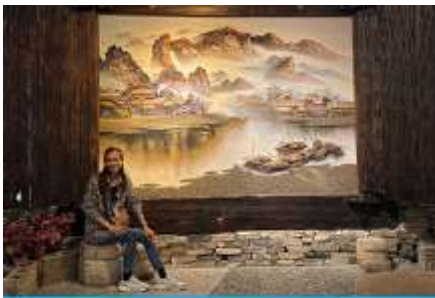
พิพิธภัณฑ์ภาพเขียนหินทราย

พักที่ ZHENMIAN HOTEL OR YINXIANG HOTEL ระดับ 4 ดาวท้องถิ่นหรือเทียบเท่าในเมืองจางเจียเจีย