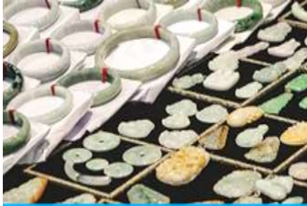
ศูนย์จำหน่ายผลิตภัณฑ์หยก

อัตราค่าบริการสำหรับโปรแกรมเสริมการแสดงชุด The love Story of Wooden man and Fairy Fox ท่านละ 400 หยวน (หรือ 2,000 บาทขึ้นอยู่กับอัตราแลกเปลี่ยน) ระยะเวลาที่ใช้ในการเที่ยวชมการแสดง ประมาณ 3 ชั่วโมง รวมเวลาเดินทางไป กลับค่าบริการรวม ค่าบัตรเข้าชม ค่ารถรับ ส่ง และค่าน้ำที่ขงไกด์ท้องถิ่น พักที่ ZHENMIAN HOTEL โรงแรมระดับ 4 ดาวหรือเทียบเท่า