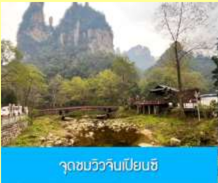
จุดชมวิวจิบเปียนซี

เช้า รับประทานอาหารเช้า ณ ห้องอาหารของโรงแรม หลังอาหารเช้าท่านพักผ่อนตามอัชฌาศัยในโรงแรม หรือ ท่านสามารถเลือกซื้อโปรแกรมเสริม OPTIONAL TOUR รายการใดรายการหนึ่ง ซึ่งเป็นโปรแกรมท่องเที่ยวที่ไม่ได้รวมอยู่ในรายการท่องเที่ยว ซึ่งมีด้วยกัน 3 โปรแกรม ได้แก่