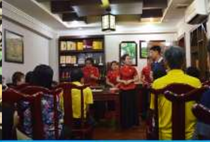
ร้านใบชา