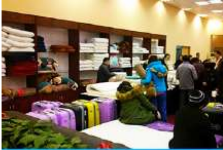
ศูนย์จำหน่ายผลิตภัณฑ์ยวพารา

พักที่ ZHENMIAN HOTEL OR YINXIANG HOTEL ระดับ 4 ดาวท้องถิ่นหรือเทียบเท่าในเมืองจางเจียเจีย