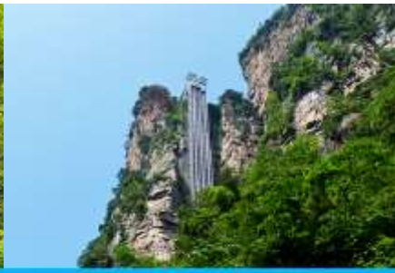
ลิฟท์แก้วไปหลว