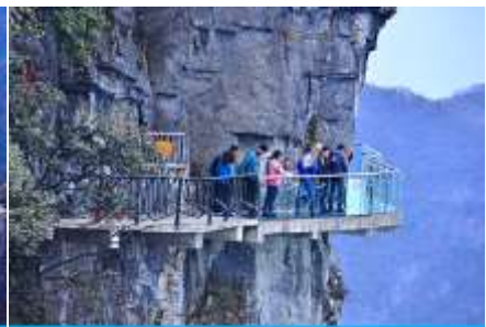
หน้าพลาวยฟ้าทางเดินกระจก