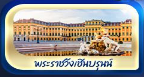
พระราชวังเซ็นบรุนน์

ท่าลมหनावบน ยอดเขาซูกสปิตเซ่ เยือนเมืองมิวนิค จักรพรรดิเวียนฟลักซ์ สัมผัสเมืองมรดกโลก เซสท์ ครุมลอฟ เยี่ยมชมปราสาทปราก เช็กอินปราสาทบราติสลาวา ล่องเรือชมความงามแม่น้ำดานูบ ชมความน่าหลงใหลของ ปราสาทบูดาเปสต์ เที่ยวชมหมู่บ้านริมทะเลสาบฮัลส์สตัดท์ พระราชวังเซ็นบรุนน์ สวนมิราเบล