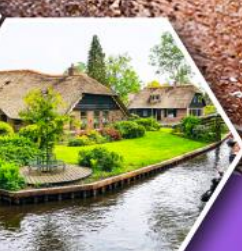
หมู่บ้านกังหัน