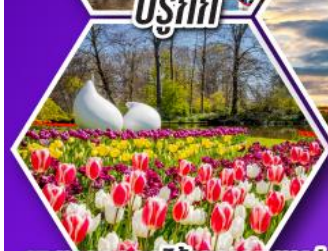
เทศกาลดอกไม้เคอเคนฮอฟ