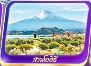
สวนโออิชิ