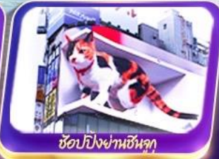
ซ็อบปีงย่านชินลุก

เดินทาง 9-14พ.ค. 68 30พ.ค.-4มิ.ย.68 11-16มิ.ย. 68