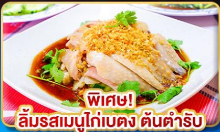
พีเชอ! ส้มรสambuไก่เบตง ต้นตำรับ