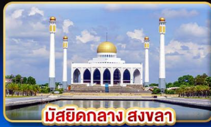
มัสยิดกลาง สงขลา