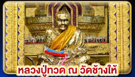
หลวงปู่ทวด ณ วัดช้างไห้