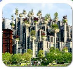
"อาคารพันต้นไม้"