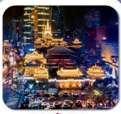
"วัดจิ้งอัน"