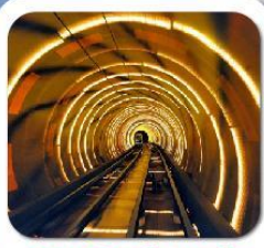
"ลอดอุโมงค์เลเซอร์"

เซี่ยงไฮ้ • ล่องเรือเมืองโบราณจเจียเจี้ยว • นั่งรถไฟลอดอุโมงค์เลเซอร์ POP MART • วัดจิ้งอัน • อาคารพันต้นไม้ • ตลาดรอยปีเงินหวงเมี่ยว อิสระช้อปปิ้งเต็มวัน หรือ จะซื้อตั๋วเที่ยวดีสนีย์แลนด์